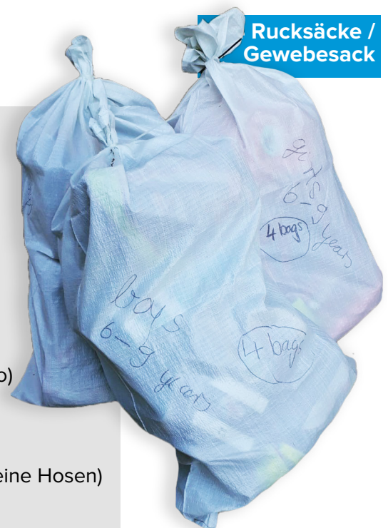
Rucksäcke / Gewebesack